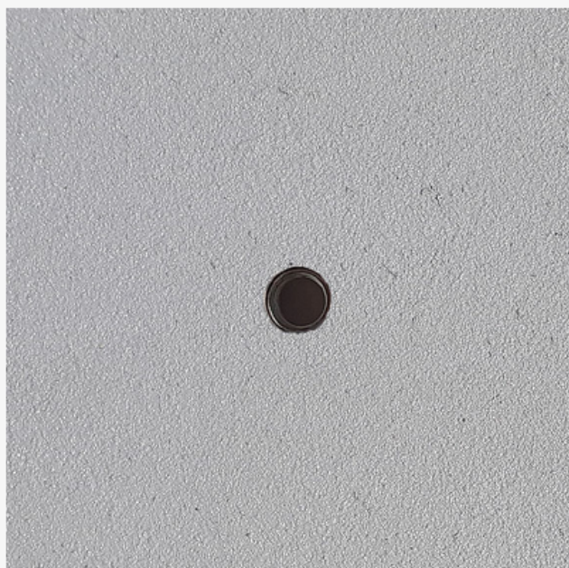
Face avant du panneau résiné